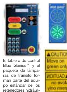
El tablero de control Blue Genius™ y el paquete de lámparas de tránsito forman parte del equipo estándar de los retenedores hidráulicos de vehículos de Blue Giant.

Los retenedores hidráulicos de vehículos de Blue Giant amarran fijamente los camiones al muelle o andén de carga, lo que mejora los niveles de seguridad durante la manipulación de cargas. Nuestros modelos son de perfil bajo, ofrecen una amplia gama de opciones de retención y pueden engancharse a una gran diversidad de barras ICC (barras protectoras contra impactos traseros), incluyendo las que estén dobladas o dañadas. Viene con el tablero de control del retenedor de vehículos Gold de la serie II Blue Genius™ y el paquete de lámparas de tránsito.